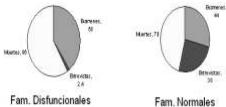
Gráficas 3 y 4