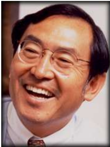
7 Kenichi Ohmae 8